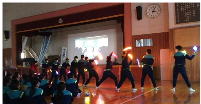
ライトスティックを持ち元気に踊る生徒達