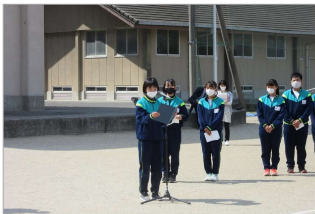
生徒代表歓迎の言葉

協和中が実践している『A・S・N』（愛される先輩になろう！）を新入生に実感してもらえるよう、これからの学校生活の様々な場面（委員会活動、部活動、学校行事等）で2・3年生の先輩たちが新入生に優しく接してくれることでしょう。