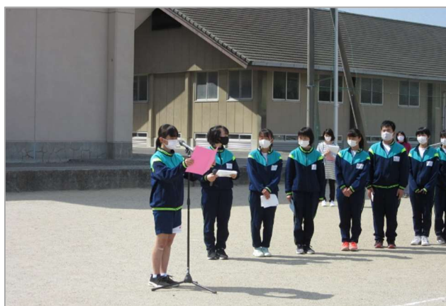
新入生代表あいさつ