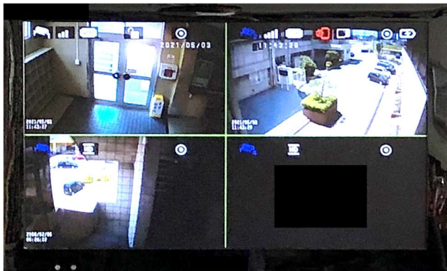
【モニター画面】・・・校長室に設定