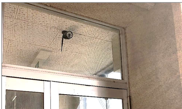
【カメラ3】・・・南校舎2階非常階段