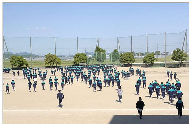
校庭に出たらは全力で避難しました

最後に、『自助』（自分の命は自分で守る）と『共助』（自分たちの地域は自分たちで守る）についての話をしました。