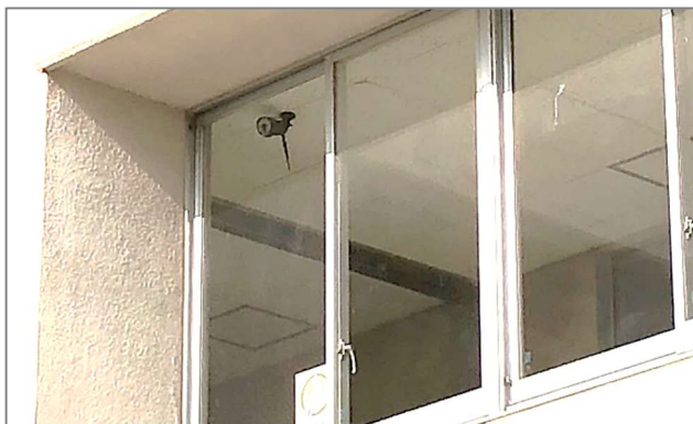
【カメラ2】・・・2階南北通路