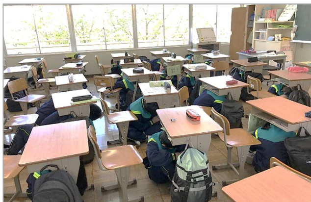
『シェイクアウト訓練』の様子

https://www.pref.tochigi.lg.jp/c08/documents/shakeout_05.mp3