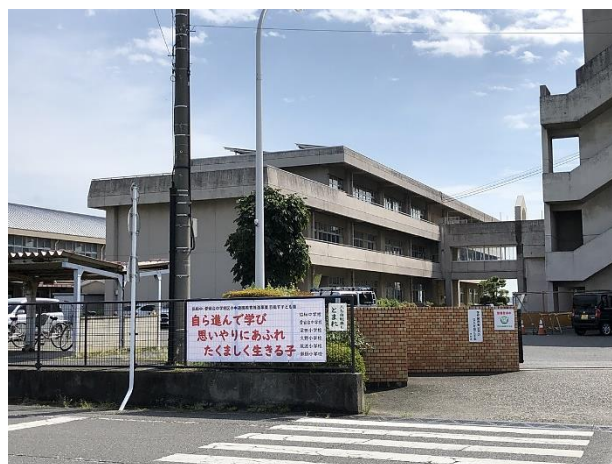
正門横に掲示された『横断幕』