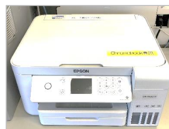
タブレットPC専用プリンター

今後も、収益金を更なる物品の購入に充てさせていただきたいと思っておりますので、地域の皆様、保護者の皆様、「毎日が廃品回収！」への更なるご協力をよろしくお願い致します。