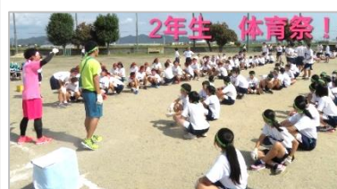
『3年間の思い出スライドショー』