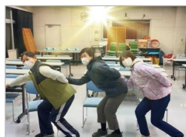
教職員による『オリジナル映画』