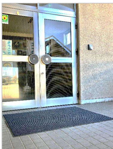
職員玄関用マット