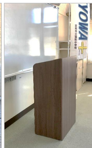
リモート講演会用演台