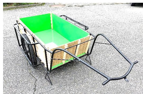
『KYOWA+号』と命名されたリヤカー

今回、修理が完了し、資源物の運搬、伐採した樹木の運搬等、様々な場面で活用させていただいています。