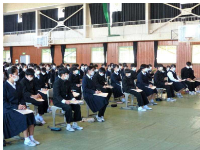
みんな、メモをとり真剣です