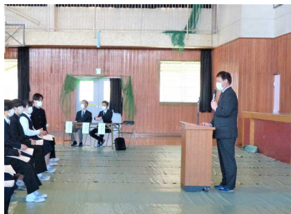
3校の先生方のお話を伺います