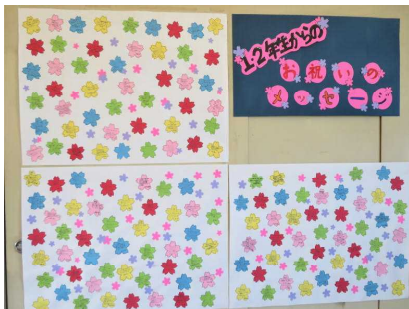
3年生フロアに掲示されています