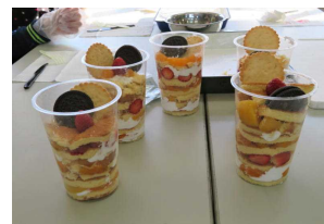
上手にできたかな？

2月17日（金）、『卒業SMILEプロジェクト』として、3年生が、 各クラスで考えた「思い出作り」 を行いました。 公園へのピクニックや室内レク、映画鑑賞、スイーツ作り などそれぞれが工夫を凝らし、みんなで協力しながら楽しむことで卒業を前に、また一つ大切な思い出が加わったことと思います。