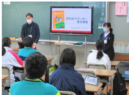
各教室でお話を伺いました

共生の社会に向け、 認知症の方や家族を応援し、誰もが暮らしやすい地域 を作っていけるよう、今回の講座で学んだことを生かしていってもらえればと思います。