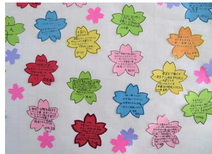
メッセージに思いを込めて