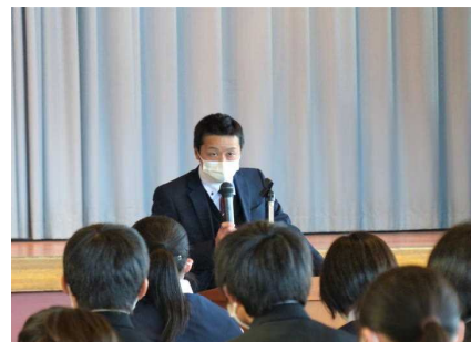
学習・生活面などのアドバイス