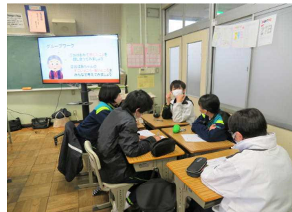
グループでも話し合いました