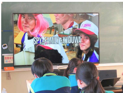
「SPY × FAMILY × KYOUWA」