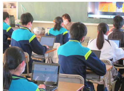
タブレット端末を使って解答