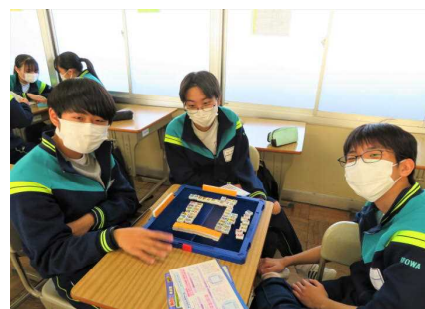
教室では「ドンジャラ」も登場