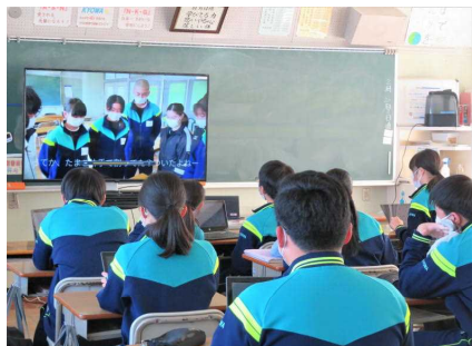
生徒会本部による力作です

どちらの動画も、「3年生に楽しんでもらいたい」という気持ちのこもった心温まる素晴らしいもので、感謝の気持ちを伝えられたことと思います。