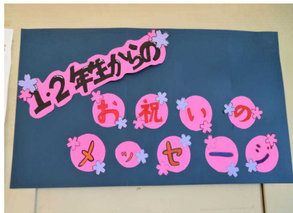
在校生からのお祝いメッセージ