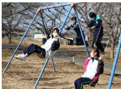
公園で、みんなでブランコ