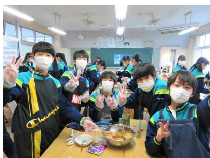
おいしいスイーツの完成！