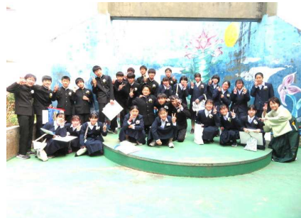
5組も、ステージ前でピース!