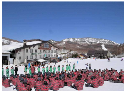
沢山のインストラクターの方々