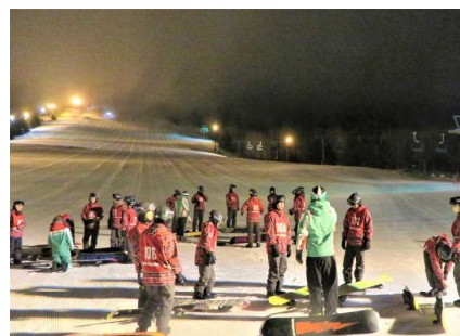
ナイトスキーも楽しみました