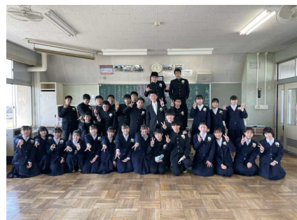
2組は、教室に並んでチーズ