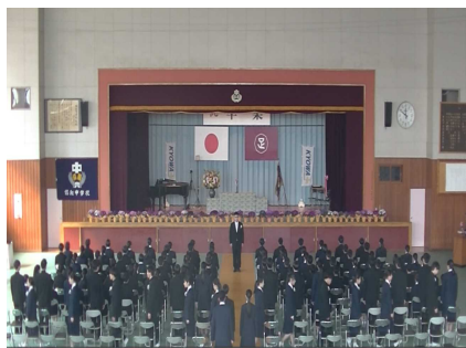
厳かで感動的な卒業式...その後の学活では? 1組は、校舎前でポーズ