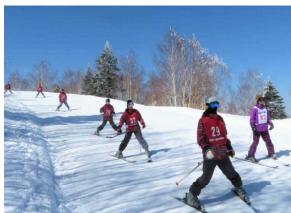
ボーゲンができれば、OK！