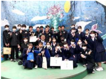
4組は、野外ステージ前に集合