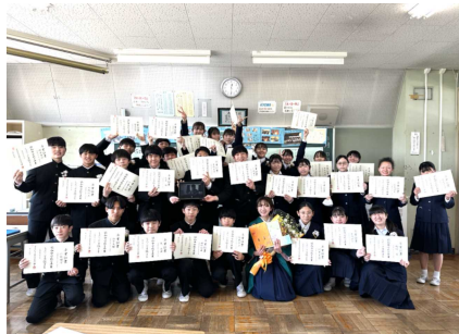
3組は、全員卒業証書を持って