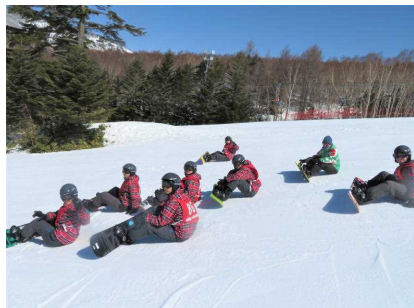
「安全な止まり方・倒れ方」から