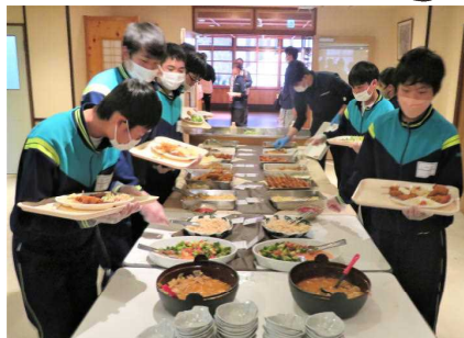
みんな並んでピュッフェです