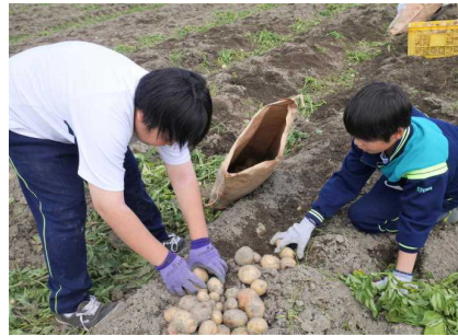
大地の恵みを感じながら