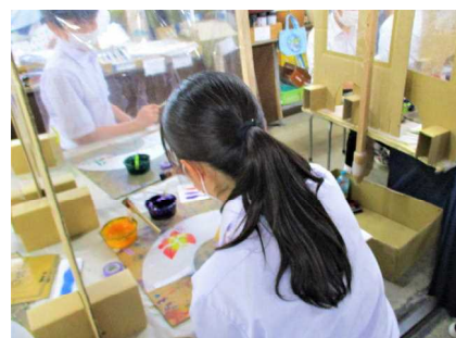
京扇子の絵付け（2組）