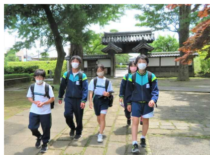
足利学校の門をくぐります