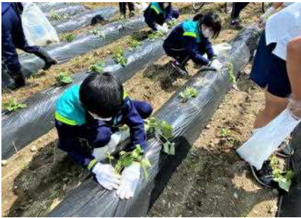
苗を1本1本ていねいに