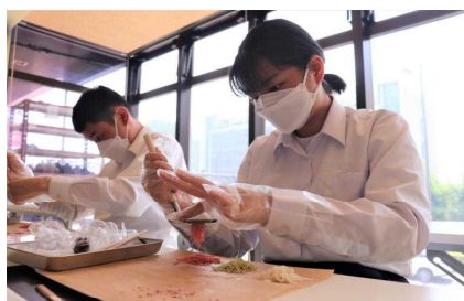
和菓子作り体験（3組）