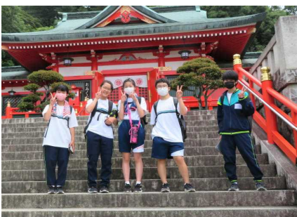
階段上って織姫神社に到着！