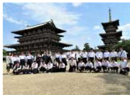
晴天の奈良・薬師寺にて

保護者の皆様には、旅行の準備から見送り・出迎えまでご理解・ご協力をいただき、誠にありがとうございました。