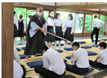
妙心寺での座禅体験