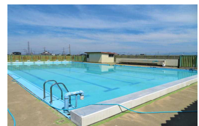
修理・清掃が完了したプール

例えば、体育の授業や運動部活動の活動中、登下校時、休み時間の運動遊びなどでは、できるだけ距離を空ける、近距離での会話を控えるといったことをはじめ、屋内では換気の徹底、各運動競技団体のガイドライン等を踏まえた取組を行うなど、必要な感染対策を行った上で対応しております。また、 様々な理由から、常にマスクの着用を希望する生徒へは、熱中症対策を講じながら、個別に対応 しておりますので、保護者の皆様におかれましても、ご理解ご協力をよろしくお願いいたします。