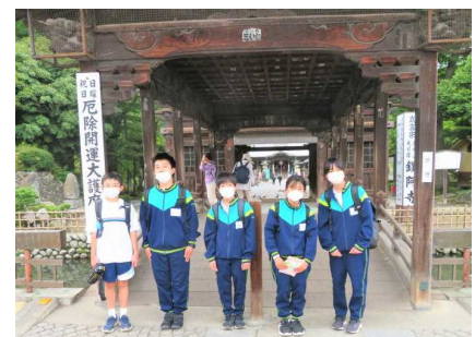
鑊阿寺 太鼓橋前にて記念撮影