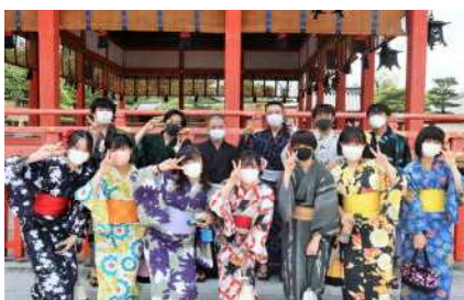
着物着付け体験（4組）