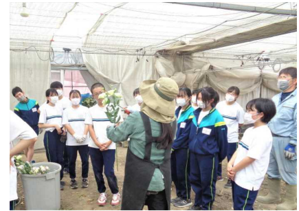
様々なお話も伺いました