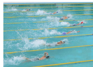
県大会を目指して

9月半ばには他の競技も行われます。 3年生から受け継いだバトン を手に、 1・2年生には、練習の成果を存分に発揮してほしい と思います