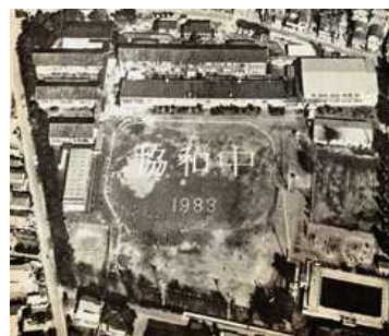
昭和58年頃の旧協和中校舎