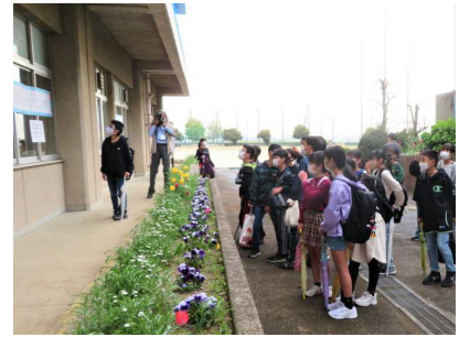
「え〜と。私は、どのクラスかな？」

新入生にとって、新たな 中学校生活への期待 。小学校卒業後、 久しぶりの友達との再会 。新しいクラスでの 友達や先生方との出会い など、様々な気持ちを抱えての協和中の第一歩となりました。