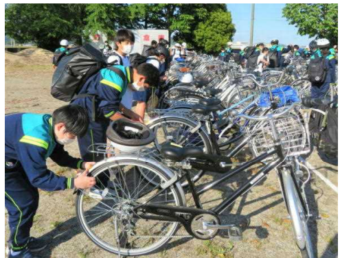
登録ステッカーをしっかりと貼ります

今後、部活動等でも自転車に乗ることが多くなります。また 栃木県の条例 により、昨年7月から 自転車保険への加入が義務化 となっていますので、保護者の皆様におかれましては、手続き方よろしくお願いたします。