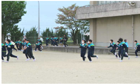
校庭に出たら、全力疾走！

避難の際の合言葉『お・か・し・も・ち』 を心がけさせ、万一のときに適切な行動ができるよう今後も指導してまいります。