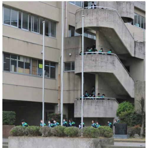
非常階段は慎重に、あわてないで！